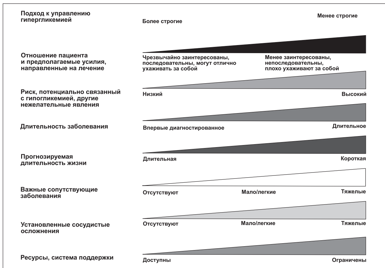
Рисунок 1. Индивидуализированный выбор целевого HbA1c (Inzucchi S.E. et al., 2012)

В исследовании EXAMINE с участием 5380 пациентов с СД 2-го типа назначение другого ингибитора DPP-4 алоглиптина в течение в среднем 1,5 года по сравнению с плацебо также не привело к снижению смертности и макроваскулярных событий. В то же время не отмечалось увеличения частоты госпитализаций по поводу сердечной недостаточности [25]. Возможно, скромность данных результатов связана с существенным улучшением помощи больным с сердечно-сосудистыми заболеваниями в современном мире, в связи с чем крупные сердечно-сосудистые события встречаются существенно реже, в том числе у больных СД 2-го типа. Сходные результаты наблюдались также в исследовании ORIGIN в отличавшейся от двух предыдущих